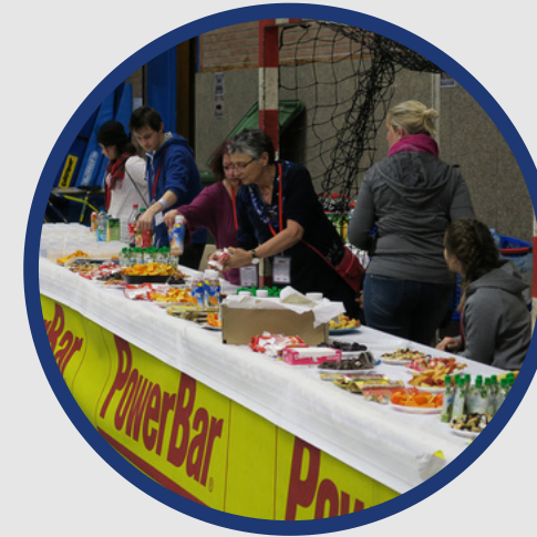
AIDE SUR VILLAGE